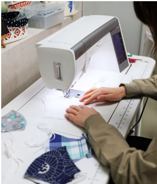
▲布マスクづくりの様子

「iFデザイン賞」、「IDEA賞」と並ぶ“世界3大デザイン賞”の一つ。デザインの革新性、機能性、人間工学、エコロジー、耐久性など9つの基準から審査される。毎年世界70か国以上の企業、組織、デザイナーから1万件を超える応募がある。